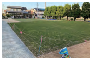
米田西小学校下駄箱前広場の芝生化状況です

私は令和2年から県の補助金を活用した公園の芝生化・緑化に取り組んでおり、新たな環境で多くの子ども達がイキイキと遊ぶ様子を見てその効果を実感しました。このことをきっかけに小学校校庭内の芝生化・緑化を考え、令和3年度より私の住む校区の高砂市立米田西小学校内でボランティア仲間を募り可能なエリアの芝生化・緑化に取り組んでいます。